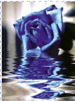
版主:王.奥.唐一丁.刘.美