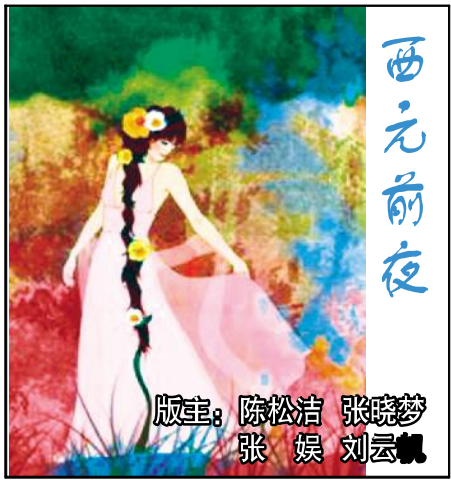
版主：陈松洁 张晓梦 张娱 刘云帆