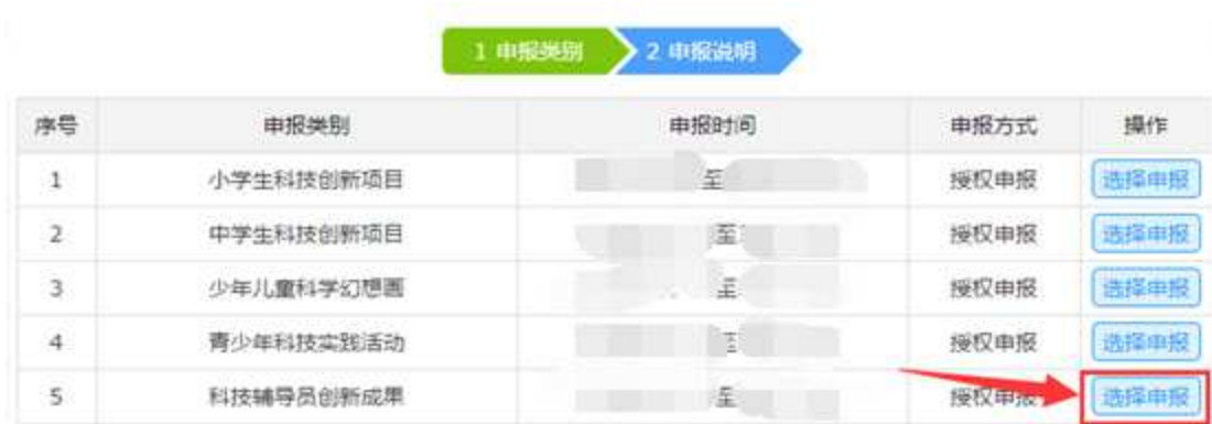
图 1-3 选择项目类型