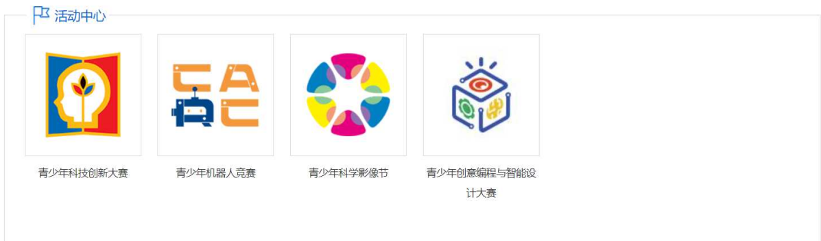
图 1-1 选择活动类型