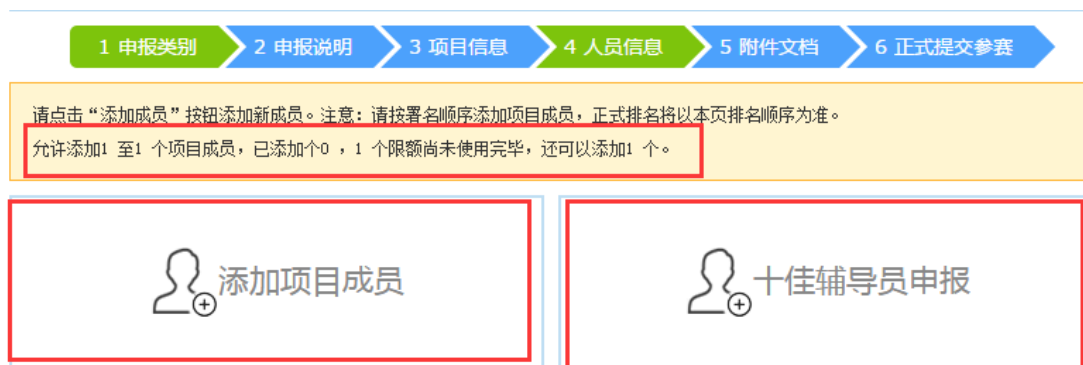
图 3-1 人员信息

第一步，在该页面的上部分有说明文字显示人员数量信息，在提交过程中请仔细查看，并且在该页面可以添加项目成员和十佳辅导员。