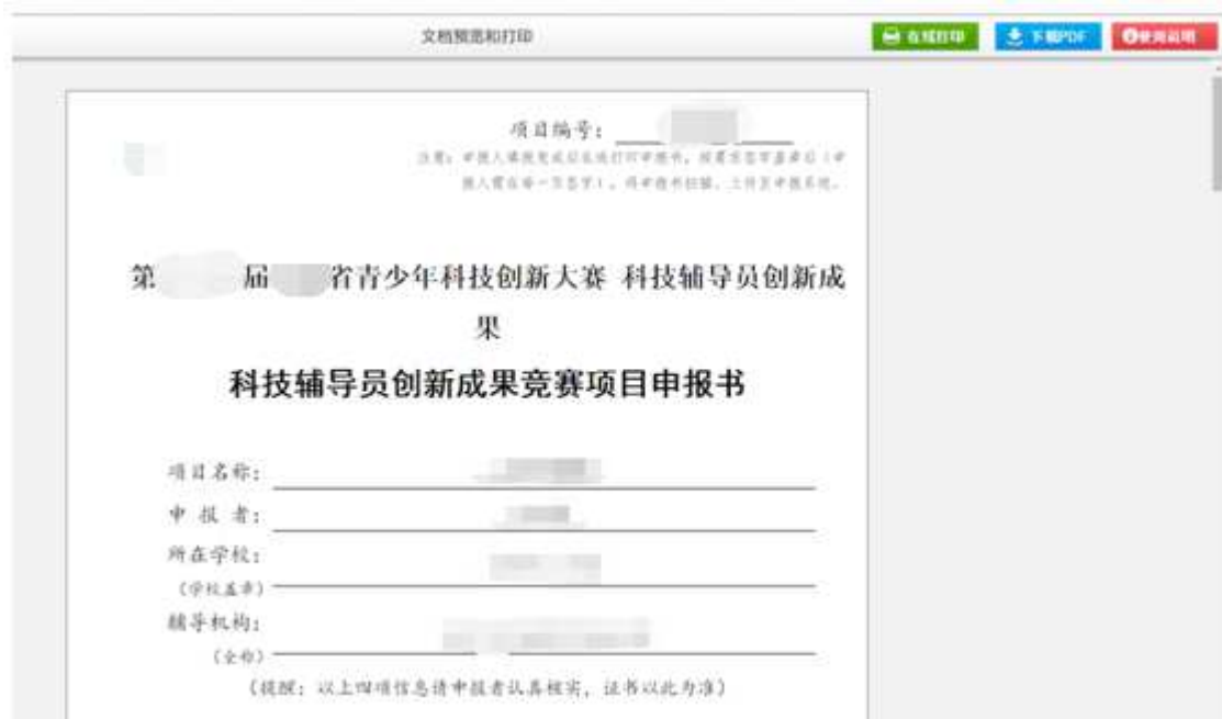
图 6-2 打印页面

第二步，通过“在线打印”与“下载 pdf”打印申报书，同时提醒各位申报者，只有在确认申报信息后才能在线打印和下载 pdf。